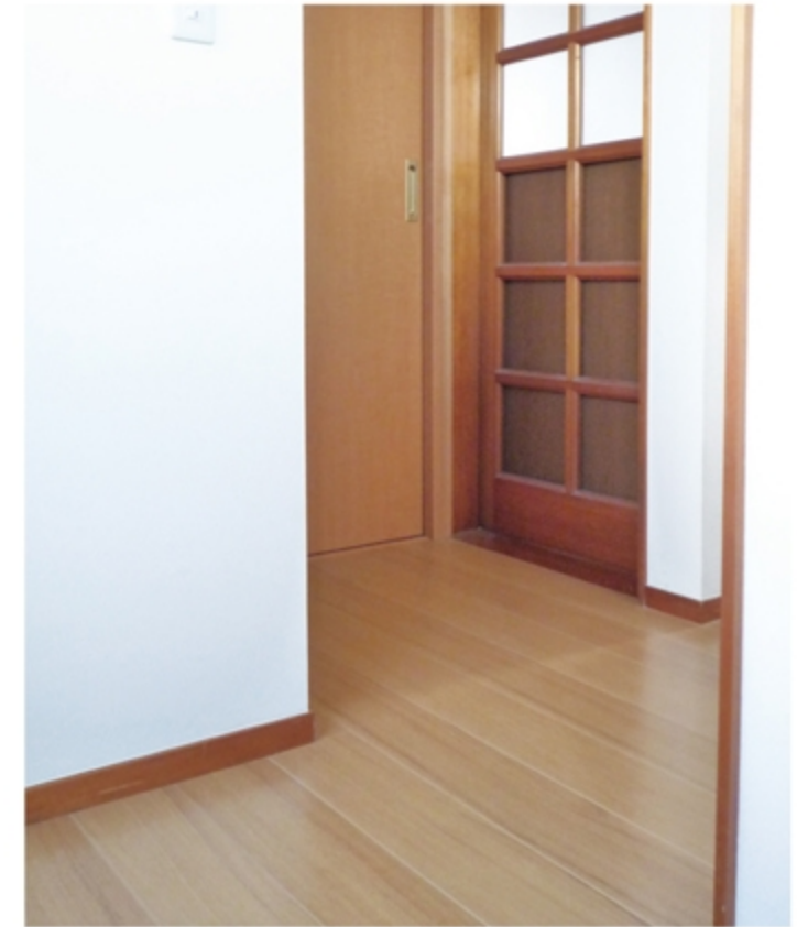
愛猫の維(ゆい)ちゃんもごきげんの壁と床。ペット専用フロアとペット対応クロスを採用。

■ キッチンがプランナーよりオススメしたYAMAHAでお決めいただきました。特にシンクの色が選べる場所、そして定評がある人造大理石の質感が奥様に気に入っていただけましたようです。 ■ トイレの入口ドアに折れ戸を採用、奥の一面に淡いグリーンのクロスを貼ってスッキリ明るい空間になりました。 ■ 浴室はひとまわり広くなるタイプをK様自ら探され、足が伸ばせるようになりました。ご夫妻共にとてもご満足いただけているようです。 ■ 入口の扉は引き戸に、洗濯機と洗面の位置を見直してレイアウトを変更。すると開口幅が広く、動きやすい空間になりました。