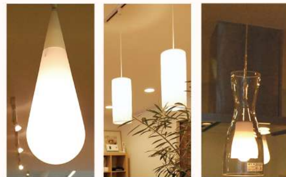
照明、換気扇、エコラットも展示しています。